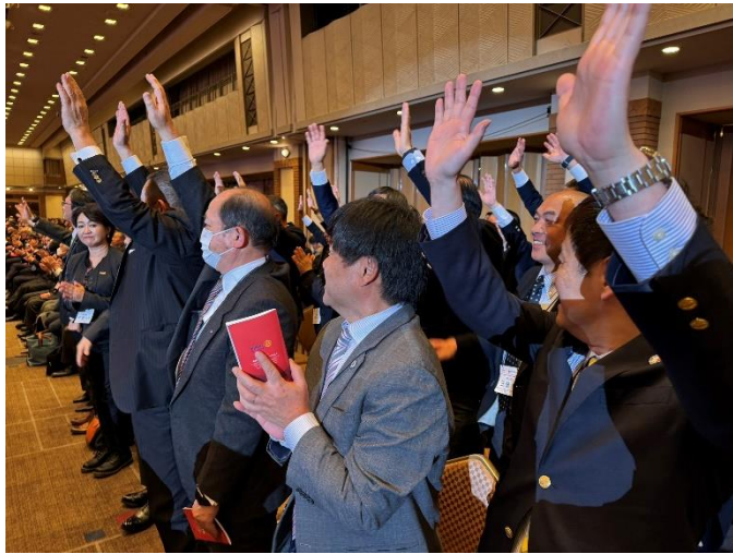
2/29(木)18:30~20:30 姉妹クラブ交流会(石垣 RC・東京上野 RC)